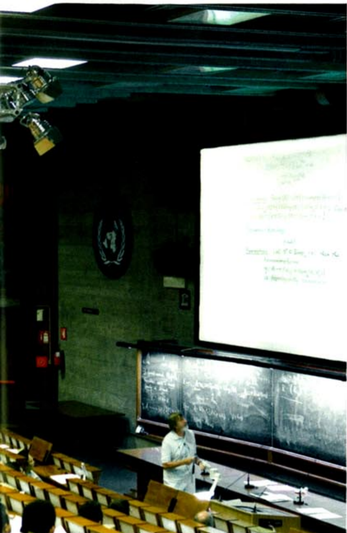
Il prof. Sreenivasan direttore dell'ICTP.

Nonostante l'importanza che rivestono i risultati scientifici, il Centro si è sempre impegnato nell'incentivare il sostegno ai Paesi svantaggiati dal punto di vista economico, dai quali tuttavia possono provenire importanti spunti.