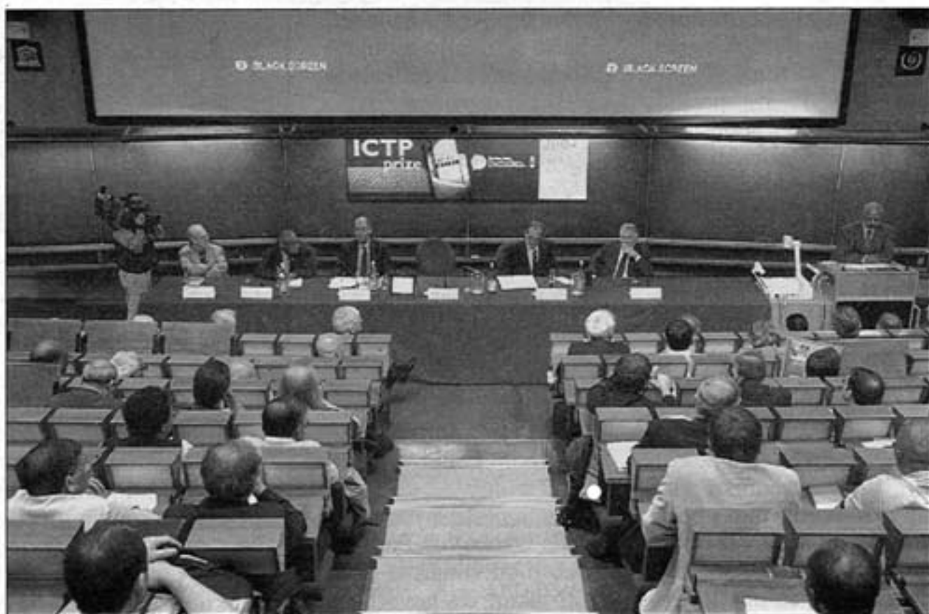
Pogled na zborni dvorano ICTP med včerajšnjo slovesnostjo