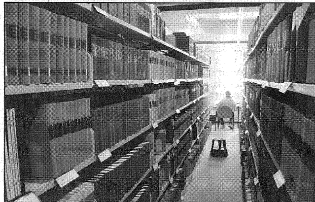
Un'altra foto di D'Agostino che verrà esposta in mostra.

Proprio per questo giovedì, per il secondo anno con-