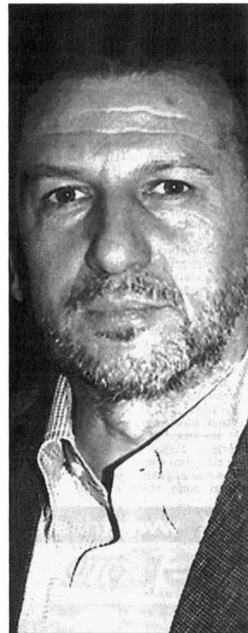
A sinistra, il Premio Nobel per la fisica 2006 George Smoot. Qui sopra, il giornalista Piero Angela e, a destra, il matematico Piergiorgio Odifreddi

ti da Lions Club Trieste Host e Teatro La Contrada, agli appuntamenti della «Fabbrica del cambiamento» allestita dall'Azienda sanitaria nel trentennale della legge 180, fino al Premio Giovanni Maria Pace per il miglior libro di divulgazione scientifica. Coinvolte anche le librerie triestine, mentre negli spazi del molo IV sarà gratuitamente aperta al pubblico la gran-